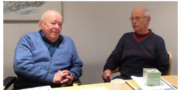
Arvonnan jälkeen Empun ja Lape jutustelua.