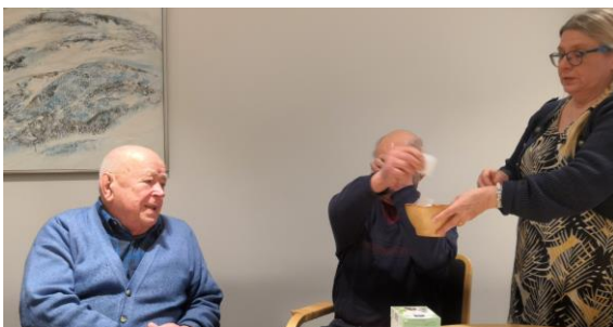
Arvonnan "onnettarena" toimi Lape.