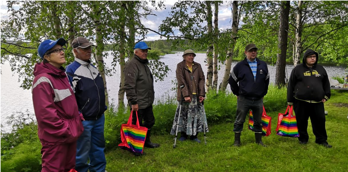
Ongintakilpailun tuloksia kuuntelemassa..