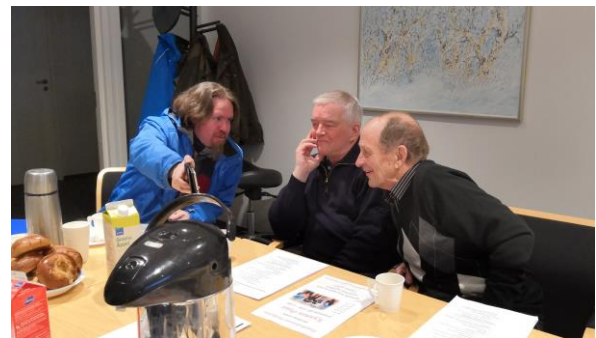
Mielenkiintoisen kuvan katselu kännykästä.