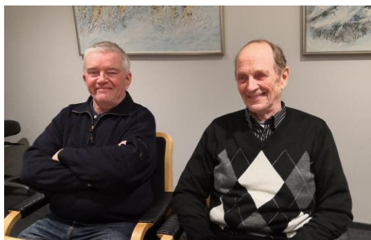
Jormalla ja Keijolla nauru herkässä...