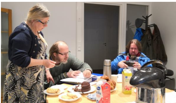
Timo allekirjoituksia laittelemassa.