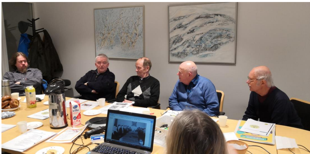
Kokouksessa keskusteltiin vilkkaasti aiemmista kokouksista ja tapahtumista sekä muisteltiin menneitä aikoja.