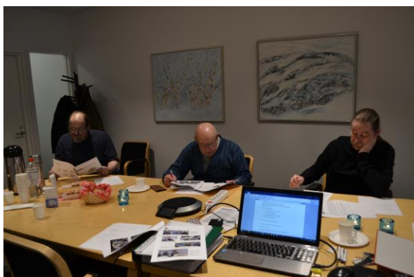
Tiivistä toimintakertomuksen tutkintaa jäsenillä