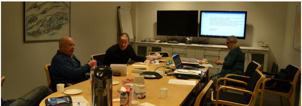
Kevätkokouksen päätteeksi kahviteltiin ja jutusteltiin mm. menneitä aikoja muistellen.