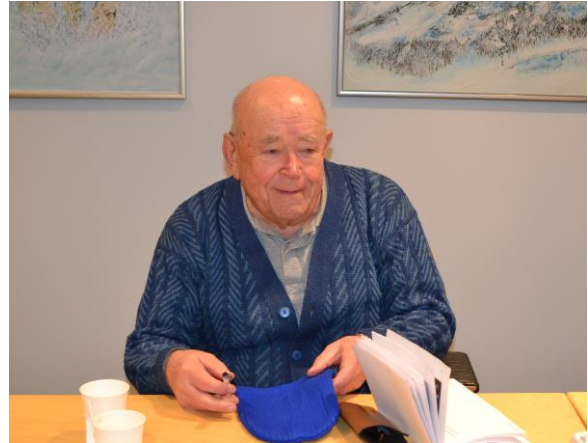
Emppua onnisti arvonnassa.