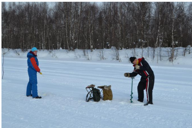
Kairaus käynnissä Lapella

Yhdistyksemme perinteiset pilkkikilpailut pidettiin Vitikanpäässä Kaarinan rannassa jo tutuksi tulleessa paikassa sunnuntaina 18.3. klo 11-13. Kisat käytiin aluksi hienon keväisen sään vallitessa kääntyen kuitenkin kisan loppua kohti aika lailla tuuliseksi ja lumisateiseksi sääksi. Kisaan ei tällä kertaa tullut kovinkaan paljon osanottajia, mutta saimme kuitenkin melkein joka sarjaan osallistujia.